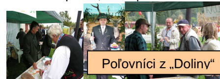
Poľovníci z „Doliny“

7. Aj z Východu spevákov aj z Máni, školu, Matičiarik, dôchodcov vozil poník, očaril poľovník!