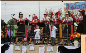
Mrchane: súbor Matice

4. Tak súbory z Matice splnia sen: -Sláviť kukurice na jeseň...Máme Trhák! Náš Kukuričňák!!!-