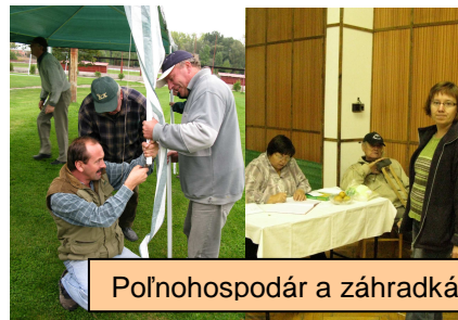
Poľnohospodár a záhradkár