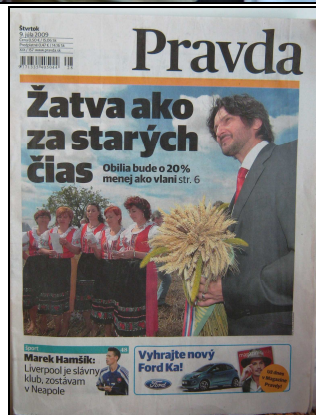
Foto : VÍTANIE PREZIDENTA KALINÁK a MRCHANE NA POLI