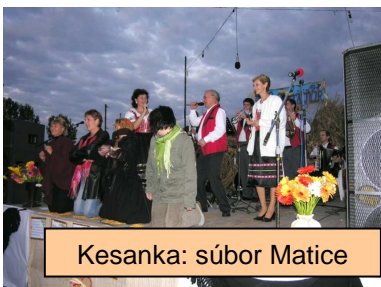
Kesanka: súbor Matice