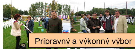
Prípravný a výkonný výbor

12. Dlh veľiký zostane, s úsmevom splatia ho... Mrchane! Ako vždycky vylieči ich chata Benických.