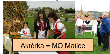
Aktérka = MO Matice

8. Len šot z našej káblovky, (ako vždy), natočil báchoroky: lietadlo...amatérky... zas bez aktérky..