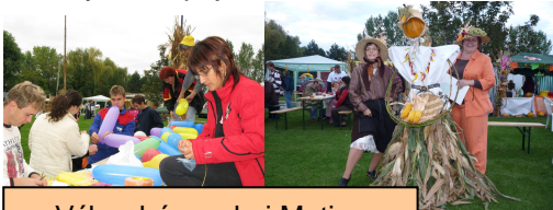
Výber bánovskej Matice

1. Výber z bánovskej Matice spraví svoj Deň kukurice, by svet spojil a Bánov oživil.