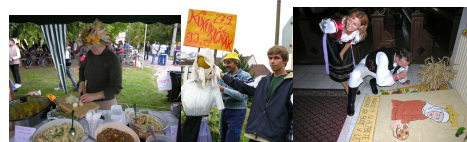
Kocúrko po kesky – 7 -