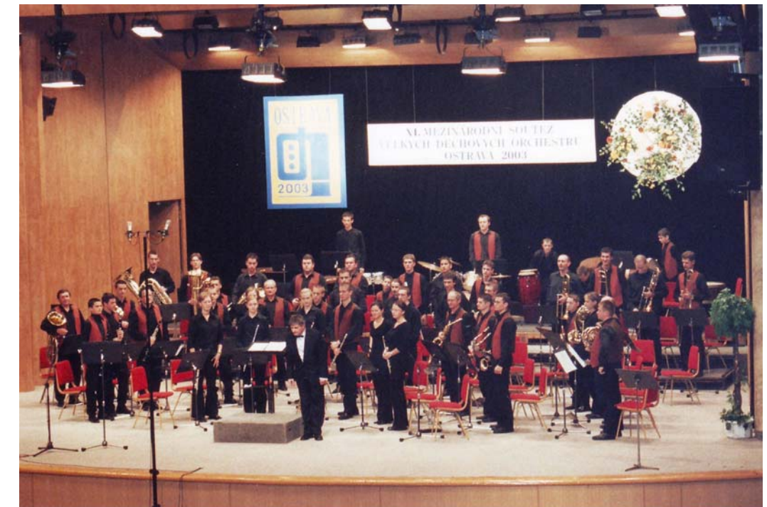
Medzinárodná súťaž veľkých dychových orchestrov Ostrava 2003