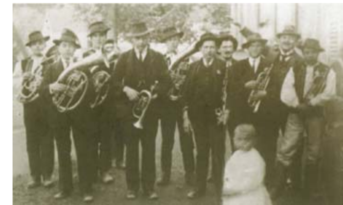
Dychová hudba z Kubry v roku 1927.