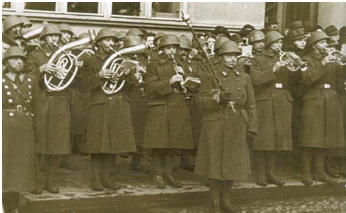
V roku 1943 hudba z Thiberghienky zastupovala vojenskú hudbu pri vojenskej prehliadke.