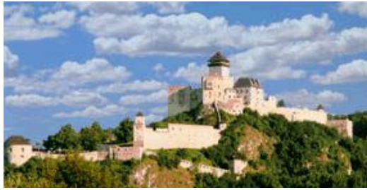
zo zdrojov mesta Trenčín