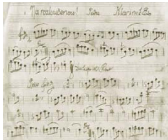
Rukopis polky Na rozlúčenou. Zachoval sa iba jeden hlas.

Nie je isté, či rumunská armáda nosila šable, ale v každom prípade pre fotografovanie to bola atraktívna dekorácia.