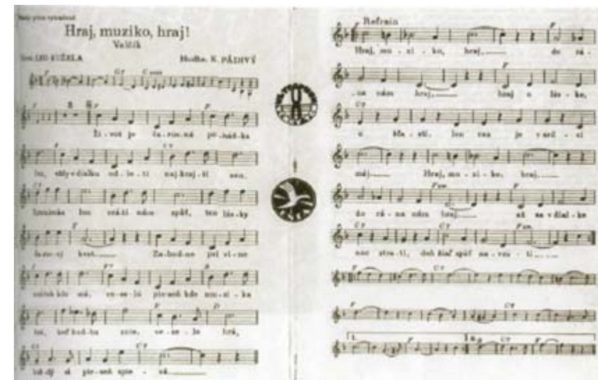
Vydavateľstvo Stožický v Bratislave vydalo pieseň a valčík Hraj, muziko, hraj.