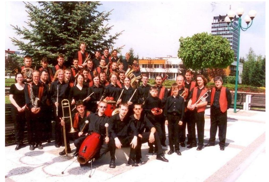
Dychový orchester ZUŠ Považská Bystrica (rok 2002)